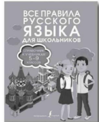
Филипп АЛЕКСЕЕВ «Все правила русского языка. Справочник к учебникам 5-9 классов».

Русский язык – это не только один из самых красивых и богатых языков в мире, но и ключевой инструмент для успешной коммуникации и образования. Освоение русской грамматики, лексики и стилистики играет важную роль в формировании культурного и эрудированного человека. Детская модельная библиотека к Международному дню родного языка, который отмечается 21 февраля, предлагает подборку пособий, справочников и словарей по русскому языку. Независимо от вашей цели – улучшить грамотность, подготовиться к экзаменам или просто расширить свой языковой арсенал, в этом списке литературы вы найдете надежных производителей в мире русской словесности.