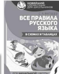
Сергей МАТВЕЕВ «Все правила русского языка в схемах и таблицах».

ждут интересные факты о языке, истории возникновения слов и устойчивых сочетаний, разбор самых распространенных ошибок. Проверить свои знания можно с помощью тестов после каждого раздела.