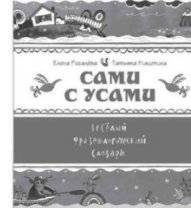
Елена РОГАЛЕВА, Татьяна НИКИТИНА

В данное пособие вошли все правила русского языка, изучаемые по программе начальной школы. Правила даны в наглядных схемах и таблицах, что способствует быстрому усвоению материала современным школьником. Для эффективного запоминания орфографические правила и исключения представлены с помощью ярких и веселых картинок. Пособие предназначено для учащихся начальных классов, а также будет полезно родителям и учителям.