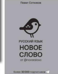
Павел СОТНИКОВ «Русский язык. Новое слово от @novoeslovo».

жет не попасть впросак. Мотай на ус интересные выражения, узнавай их скрытый смысл, выполняй увлекательные задания. Будь третьим калением! Для среднего школьного возраста.