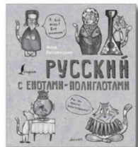
Анна БЕЛОВИЦКАЯ «Русский язык с енотами-волаголтами».

Данный справочник соответствует школьной программе по русскому языку 5-9 классов и включает в себя основные правила русского языка. Правила представлены в схемах и таблицах, что облегчает восприятие материала и делает процесс обучения более наглядным и эффективным. Все правила проиллюстрированы примерами из живой речи и художественной литературы. Каждая тема завершается несколькими упражнениями для повторения и закрепления пройденного материала. В конце книги даны ключи для самопроверки. Издание предназначено как для учащихся 5-9 классов, так и для всех, кто изучает русский язык или хочет освежить свои знания.