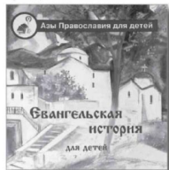
«Евангельская история для детей».

Всё, что можно узнать из этой книги, существует в действительности рядом, и это не сказка, это удивительное и чудесное любимой сказки. Это главные тайны мира! Как объяснить ребенку на доступном языке суть православной веры, кто такой Бог, что такое причастие, зачем ходить в храм и молиться. Хорошо запомните всё услышанное здесь, ведь это пригодится на всю жизнь!