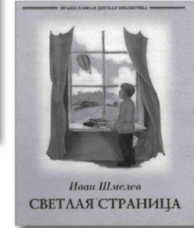
Иван ШМЕЛОВ «Светлая страница».

торжественно и печально в дни Страстной недели, какая радость наполняет его сердце после отпущения грехов, об этом юный читатель узнает из настоящей книги.