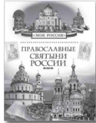
Наталья ЛЯСКОВСКАЯ «Православные святые России».

семейного чтения и адресована детям младшего школьного возраста.