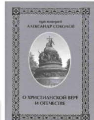
Александр СОКОЛОВ «О христианской вере и Отечестве».

Книга рассказывает детям о православных святых России: храмах, монастырях, святых источниках, иконах и других христианских реликвиях. Храмы и монастыри – это каменные летописи русского зодчества. По ним можно изучать и прошлое нашей страны, и её архитектуру. Каждая деталь храма имеет глубокий смысл и может многое рассказать о православной вере. Трудно также переоценить значение икон для верующих людей. Сегодня иконы по праву оцениваются как произведения искусства. Издание поможет проникнуться духом истории, связанной с тем или иным артефактом, понять его значение для России и русского народа. Повествование насыщено историко-культурными сведениями, и при этом тесно связано с современностью.