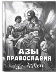
«Азы Православия для детей».

Весна открывает целую череду самых светлых и прекрасных праздников: Благовещение, Пасха, День Победы, Неделя славянской письменности и культуры, соединенная с праздником русского языка. В чудесный хорост этих праздников вляется и День православной книги. Именно она – главный источник культуры, мудрый учитель жизни. Книга определяет духовное рождение и становление личности, оживает историческую память в каждом человеке. Обращение к православной книге – это возможность найти ответы на многие насущные вопросы. Детская модельная библиотека предлагает познакомиться с православной литературой о добре и человечности, о любви и сострадании, которые обладают большой силой воспитательного воздействия. Представленные книги будут интересны не только детям, но и их родителям.