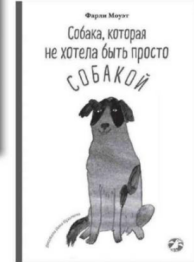
Фарли МОУЗТ «Собака, которая не хотела быть просто собакой».