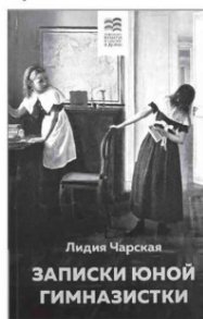
Лидия ЧАРСКАЯ «Записки юной гимназистки».

дой, голодает. Он в одиночку борется за своё существование, не принимая милостыни и помощи от окружающих. Благодаря молодой учительнице французского Лидии Михайловне мальчик открывает для себя новый мир, где люди могут доверять друг другу, поддерживать и помогать, разделять горе и радость, избавлять от одиночества. Уроки французского оказываются уроками доброты и милосердия.