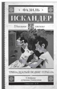
Фазиль ИСКАНДЕР «Тринадцатый подвиг Геракла».

Виктор ДРАГУНСКИЙ «Денискины рассказы». Многие взрослые писатели ломают голову, чтобы понять, как у Виктора Драгунского получились такие смешные «Денискины рассказы». Но мы – то с вами знаем, что те каламбуры, в которые попадает Дениска Кораблёв вместе со своими друзьями и вызывают веселый и добрый смех. Так что не ломайте головы, открываем эту книгу и погружаемся в добрый мир детства – мир «Денискиных рассказов»! Произведения входят в программу обязательного чтения в начальной школе.